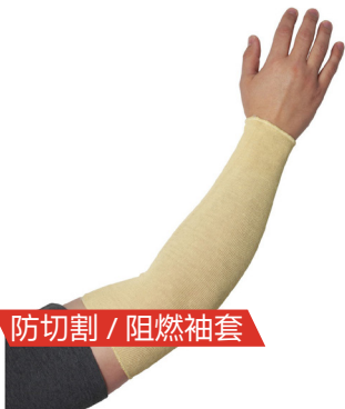
防切割 / 阻燃袖套

适用于：汽车与运输、金属加工、机械及设备、石油和化工业、建筑业、采矿业所有产生高温的工作环境中