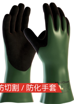
防切割 / 防化手套